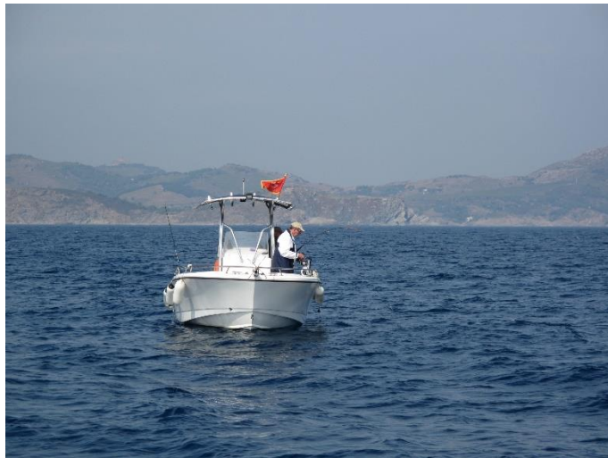
© Office français de la biodiversité