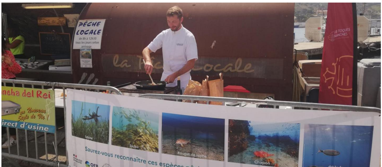
Chef cuisinier de l'association des Toques blanches du Roussillon Occitanie sur le marché de caractère à Port-Vendres