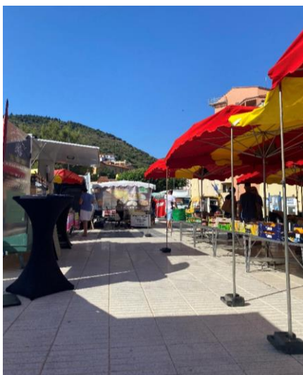
Marché de caractère à Cerbère

Pour plus d'informations, rendez-vous sur la page Facebook @lesportsdecaractère.